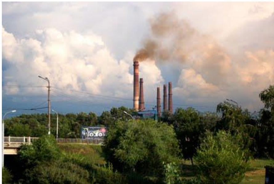
Мартен закрито у 2012 році