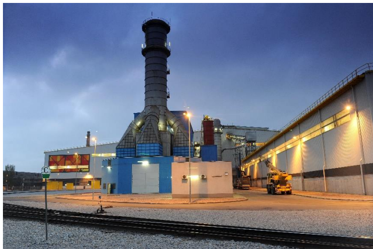
Система газоочистки на заводі ІНТЕРПАЙП СТАЛЬ, м. Дніпро

ІНТЕРПАЙП Сталь побудована згідно найжорсткіших європейських стандартів і є аналогом сучасних європейських підприємств