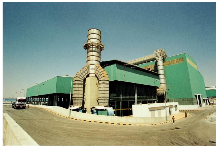
Система газоочистки на заводі Daniela, м. Удіно (10 км від Венеції)