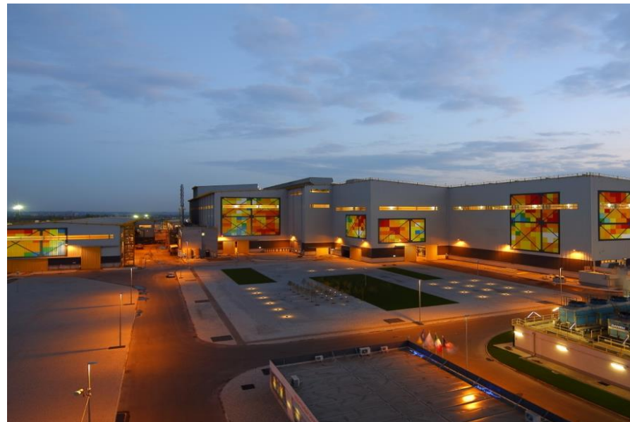
$1 млрд інвестицій